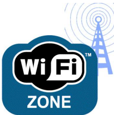
Figura: Destacando o símbolo do wifi