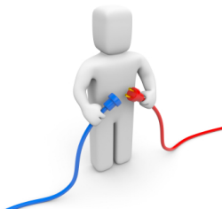
Figura: Destacando a conectividade